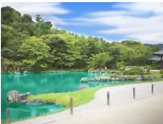
天龍寺曹源池庭園

嵐山を象徴する建造物「渡月橋」／世界遺産の曹源池庭園がある「天龍寺」を観光できるエリアです。「嵐電嵐山駅」や「トロッコ列車」を見学することもできます。