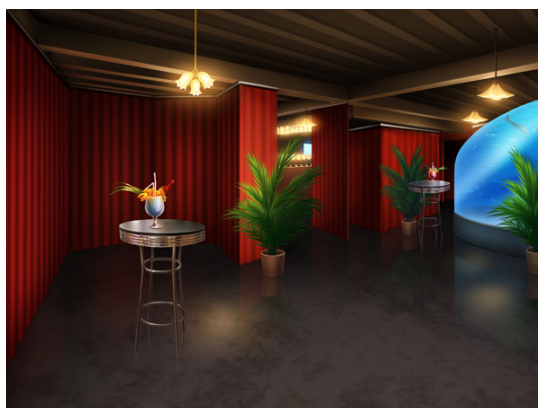
DJ Cafe muzie 店内