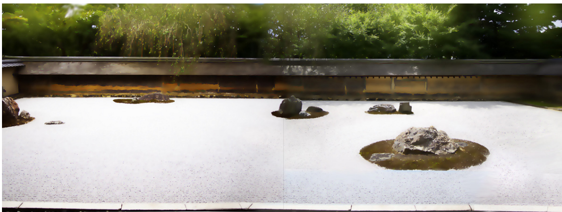
龍安寺 枯山水石庭