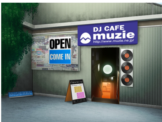
DJ Cafe muzie 入口

【日本最大級のインディーズ音楽&コミュニティサイト「muzie」】( http://www.muzie.ne.jp/ ) より提供していただいた楽曲を聞きながら他の生徒との時間を過ごせる「DJ Cafe muzie」へ行くことができます。メインフロアはノージャンル曲がランダムに流れるスペース、小さなブースはジャンルごとに5つに分けられたスペースを用意。趣味の合う生徒同士で交流を深めることができます。