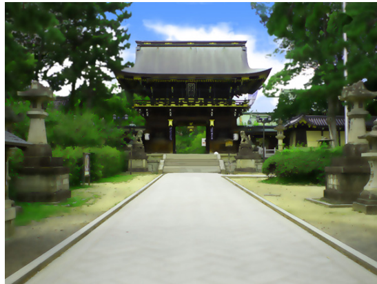
北野天満宮 三光門